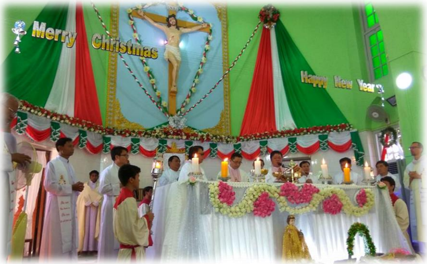
ပရိတ်သုဇပဏီတော် ယေဇူးပွဲတော်... စာ (၁၅)