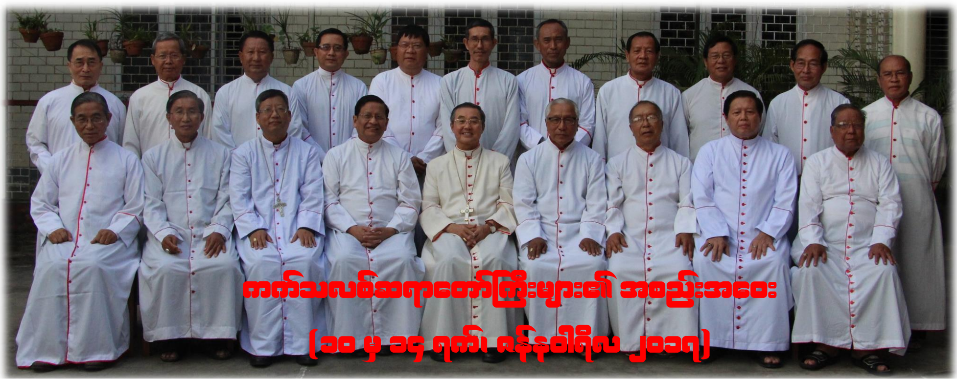
ကက်သလစ်ဆရာတော်ကြီးများ၏ အစည်းအဝေး (၁၀ မှ ၁၄ ရက်၊ ဇန်နဝါရီလ ၂၀၁၇)