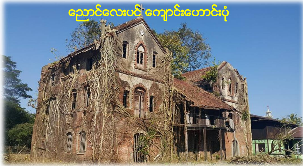
ညောင်လေးပင် ကျောင်းဟောင်းပုံ