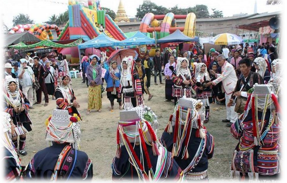
အာခါလူမျိုးတို့၏ နှစ်သစ်ကူးပွဲတော် ... . စာ (၁၄)