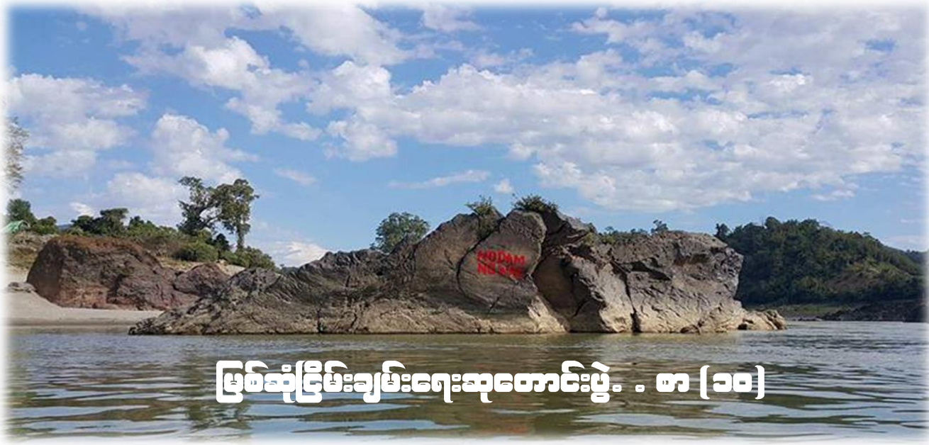
မြစ်ဆုံငြိမ်းချမ်းရေးဆုတောင်းပွဲ... စာ (၁၀)