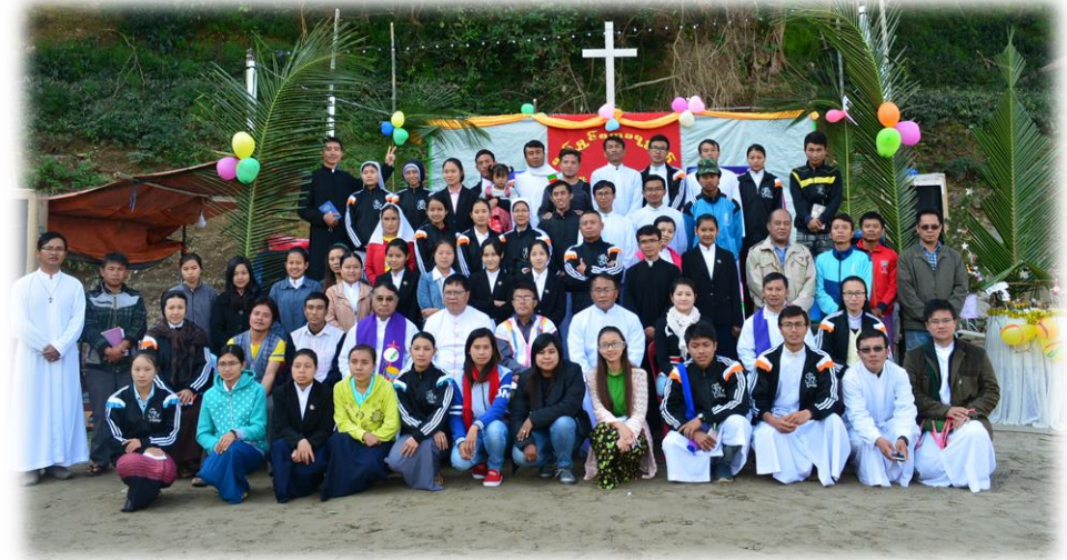
တောင်ကြီးခိုလှမ်းချုပ်သာသနာ.....စာ(၁၄)