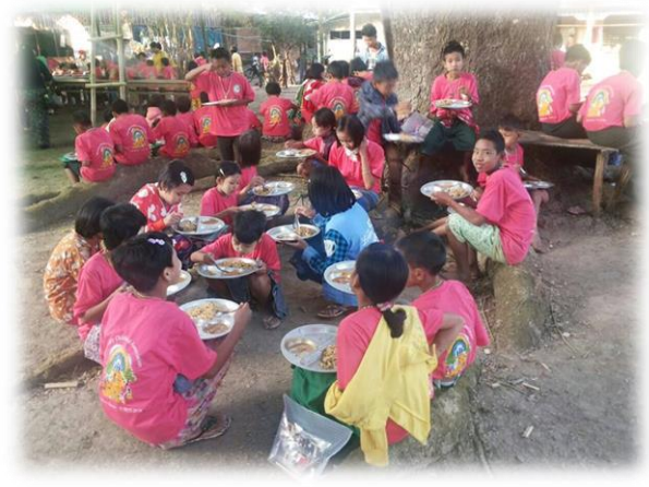
သာသနာပြုကလေးသူငယ်များ ...စာ (၁၅)