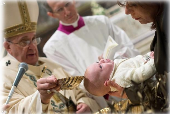
ကလေးဖော်(၂၈)ဦး ဆေးကြောခြင်း....စာ(၄)