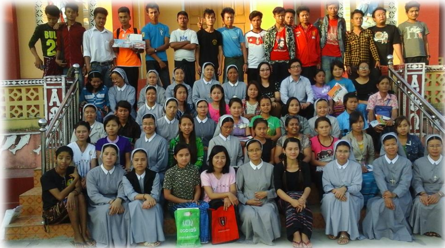
TOT သင်တန်း ... .စာ(၁၄)