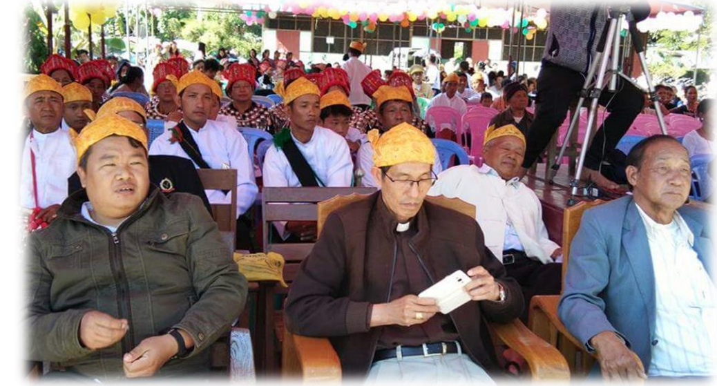
ကချင်ရိုးရာအနုပညာဇွမ်းရည်ပြိုင်ပွဲ...စာ (၁၇)