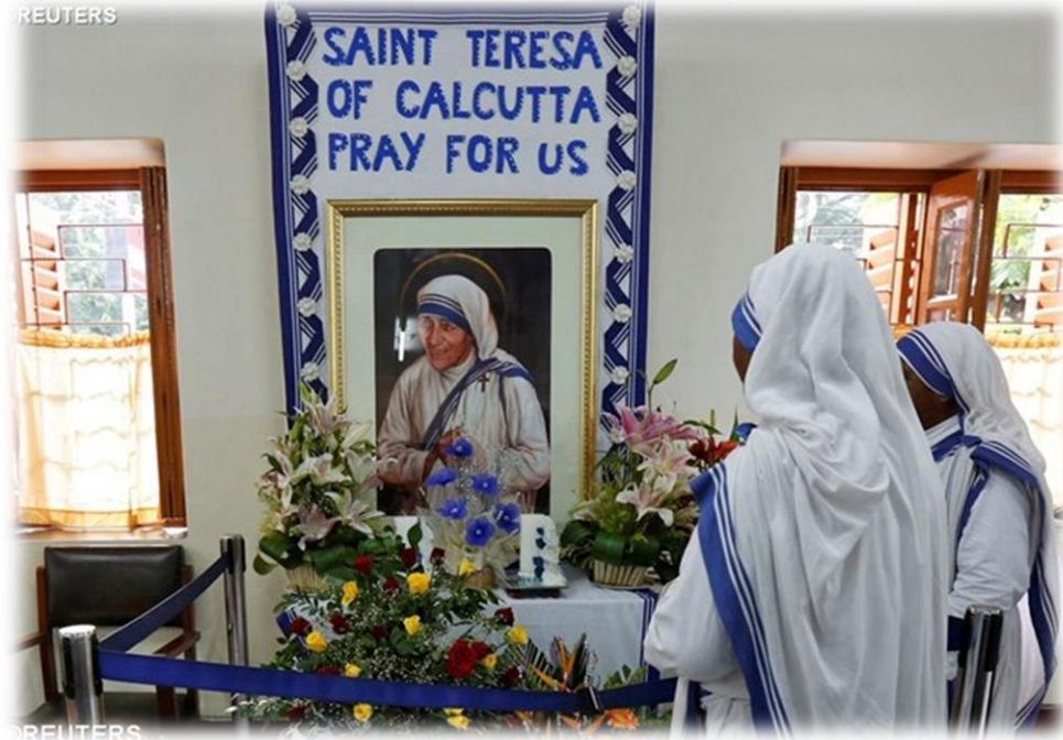
မာသာရီထရေးဇာ၏ မိဒီယာအဖွဲ့မှ ပွဲတော်နှင့် ပတ်သက်သော ဂုဏ်ပြုခြင်း အခမ်းအနားများသည် အသင်းတော်ကအ

အိန္ဒိယနိုင်ငံ Goa မြို့တွင်ရှိသော ကက်သလစ်အသင်းတော်သည် ဇန်နဝါရီ လ (၅) ရက်နေ့မှစတင်ကာ ခြောက်ရက် တိုင်တိုင် မာသာရီထရေးဇာနှင့် ပတ်သက် သော နိုင်ငံတကာဂုဏ်ရည်ပွဲကို ကျင်းပပြု လုပ်ခဲ့သည်။ ထိုသို့ပြုလုပ်ခြင်းမှာ မာသာ ထရေးဇာ၏ ဘဝအသက်တာနှင့် လုပ် ဆောင်ချက်များအကြောင်းကို အိန္ဒိယလူမျိုး များအပြင် လူအများအပြား ပိုမိုသိရှိလာနိုင် ရန်ထိုက်သည့် နိုင်ငံတကာ ဂုဏ်ရည်ပွဲတော်ကို ကျင်းပခြင်းဖြစ်သည်။ မာသာထရေးဇာ၏ ဘဝအကြောင်းနှင့် လူမှုအသိုင်းအဝိုင်းအား သူမအစေခံခဲ့ပုံကို ကြည့်ခြင်းအားဖြင့်လူအ များအပြား မိမိတို့၏အသက်တာထဲ၌ နီးစပ် သူများကိုပိုမိုအစေခံလိုစိတ်များဖြင့်ပေါ်လာ ရန်ရည်ရွယ်ကာ နိုင်ငံတကာ အနေ ဖြင့် ထုတ်လွှတ်ပြသခြင်းဖြစ်သည်ဟု၎င်းတို့က နယ်ရှိ ဗဟိုလူထုဆက်သွယ်ရေး ဖော်ပြ သွား ခဲ့သည်။