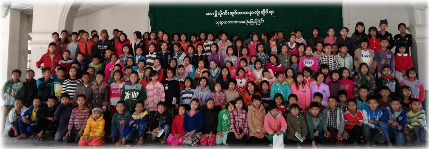
စစ္စတာရ် ဂါဗြီအိလ်(SJA)

လားရှိုးသာသနာအတွင်းရှိ သာသနာပြုကလေးသူငယ်များအသင်းမှ တာဝန်ခံများ၏ စုပေါင်းအားထုတ်မှုဖြင့် တစ်နှစ်လျှင် တစ်ကြိမ် ဘုရားစကားစာမေးပွဲကို သာသနာအဆင့်ပြင်ဆင်ကျင်းပကြသည်။ ယခုနှစ်၏ အဓိက ဦးစားပေးသင်ကြား/ဖြေဆိုကြသည့် အကြောင်းအရာမှာ “စက္ကရာမင်းတူး(၇)ပါး” ဖြစ်သည်။ တိုက်နယ်အသီးသီးမှ ဘုရားစကားသင်ကြားနေသည့် တာဝန်ခံအားလုံးတို့က အကြီးတန်း/အငယ်တန်းခွဲ၍ မေးခွန်းတစ်စုံစီ ပြင်ဆင်ပြီးပေးပို့လာသည်ကိုစုစည်းကာ ဗဟိုမှ မေးခွန်းတစ်စုံအဖြစ် အဆင့်ဆင့် ပြန်လည်ပြင်ဆင်သည်။ ထို့နောက် တိုက်နယ်အသီးသီးသို့ပြန်လည်ပို့ဆောင်ဖြေဆိုစေပြီး အဖြေလွှာများကိုလည်း ဗဟိုမှပင် တာဝန်ယူ စစ်ဆေး၍ အမှတ်ခြစ်ပေးမည်ဖြစ်သည်။ ဆုပေးပွဲကို နှစ်စဉ်ဒီဇင်ဘာ(၂၈)ရက် “ The Holy Innocents’ Day ” တွင် ကျင်းပလေ့ရှိသည်။ တာဝန်ခံများ၏ စည်းလုံးညီညွတ်စွာ ကြိုးစားအားထုတ်မှုနှင့် ကလေးငယ်များ၏ အားတက်သရော ပါဝင်ဆောင်ရွက်/ဆင်နွှဲမှုတို့သည် အလွန်စွာနှစ်ထောင်း အားရဖွယ်ကောင်းလှပေသည်။